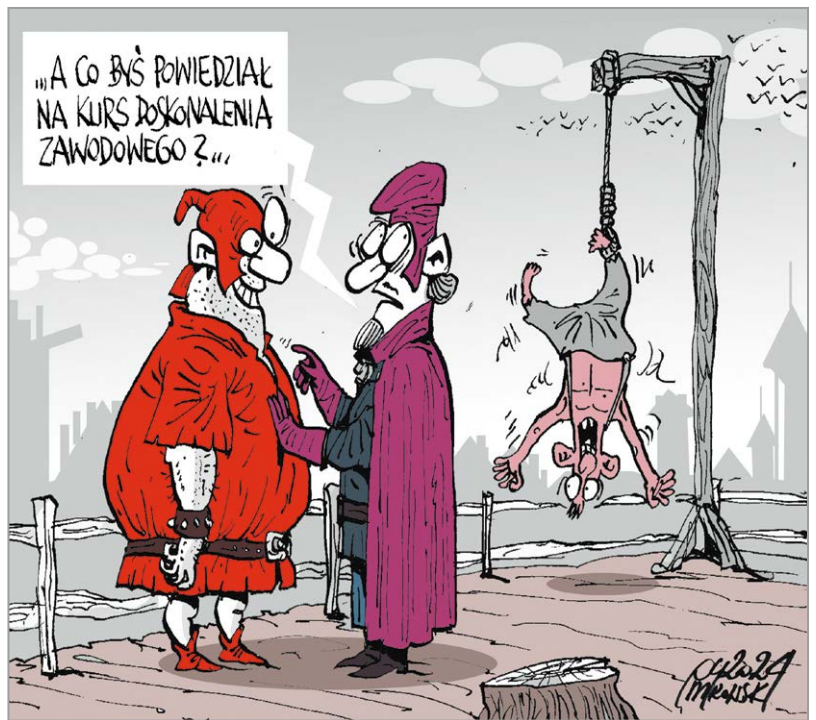
rys. Robert Mirowski