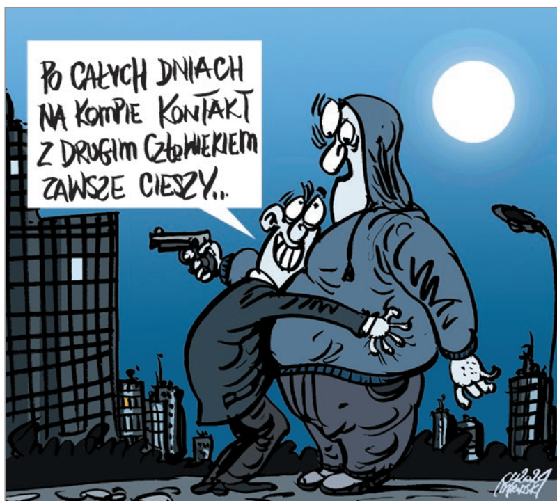
rys. Robert Mirowski