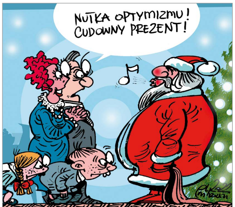
rys. Robert Mirowski