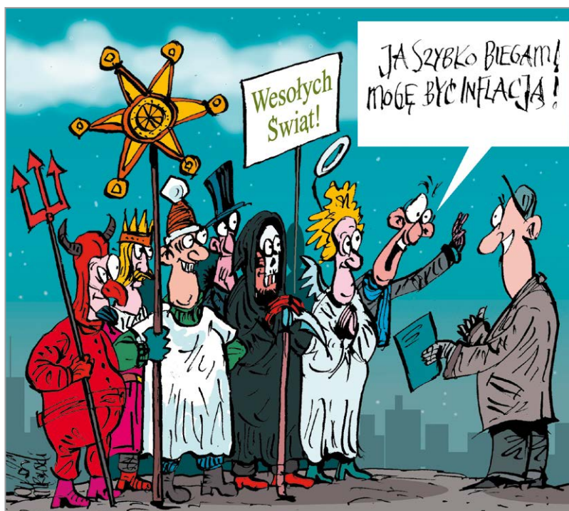
rys. Robert Mirowski